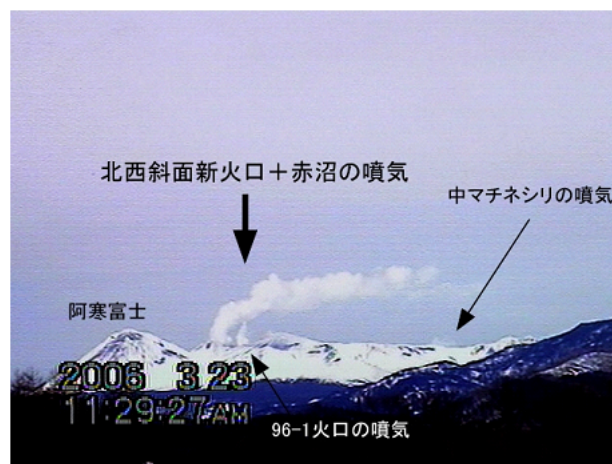
図1：解析に使用した画像。火口から南東16kmに位置する上徹別より撮影

解析した噴煙は北西斜面新火口と赤沼火口からの噴煙が一体となったものである。赤沼火口からの噴煙量が圧倒的に大きく、北西斜面に形成された新火口や96-1火口からの噴煙量は、相対的に無視できる程度である。